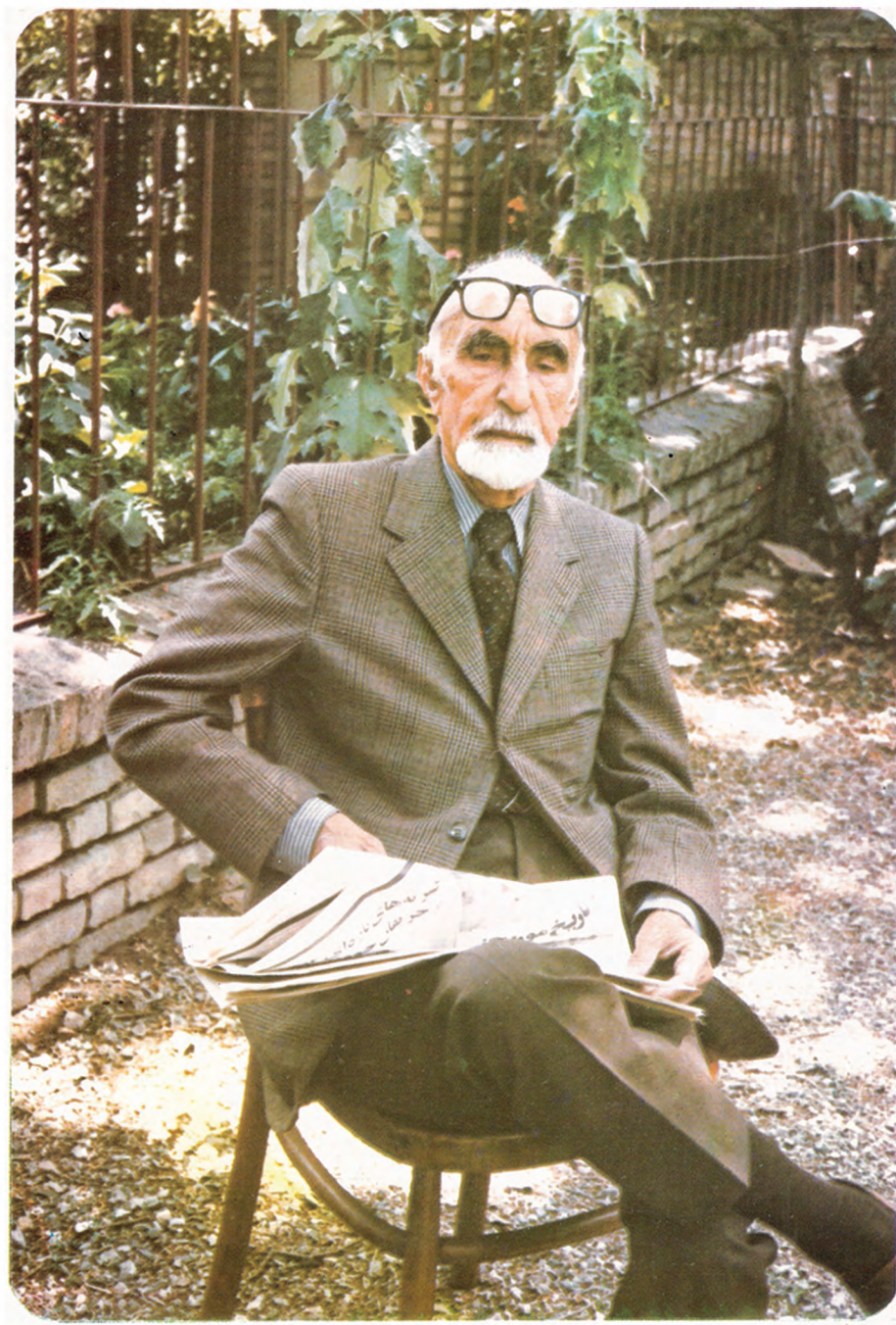
دکتر محمود افشار یزدی (۱۲۷۲ - ۲۸ آذر ۱۳۶۲) واقف و بنیانگذار انتشارات دکتر محمود افشار